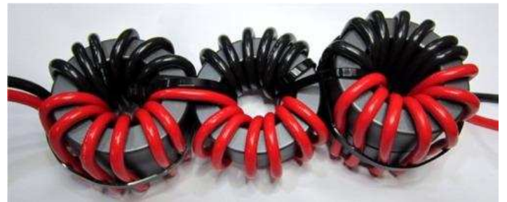
回路 キャンセル巻き